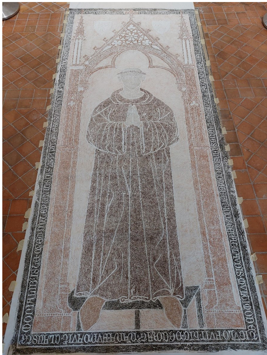
Photo 6, frottis terminé.