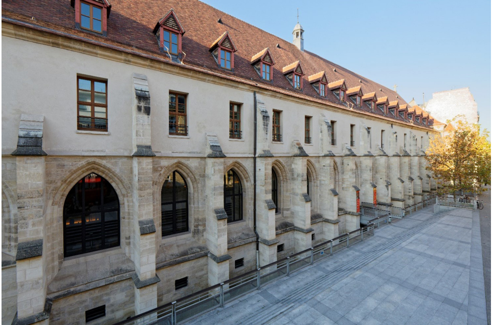
Photo 1, Le flanc est du Collège, rue de Paissy

Texte et Frottis Reinhard J. Lamp, Hamburg