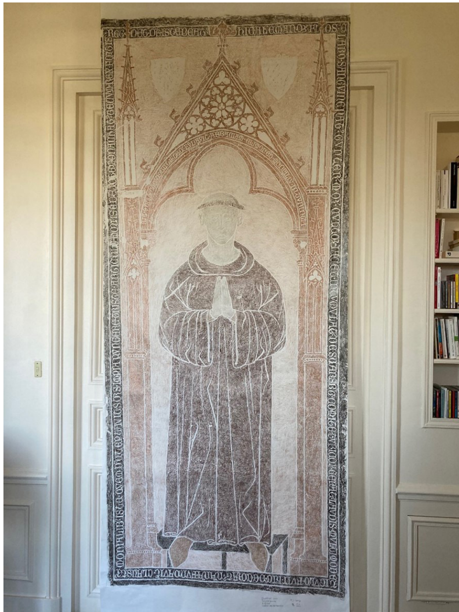
Photo 7, frottis pendu.