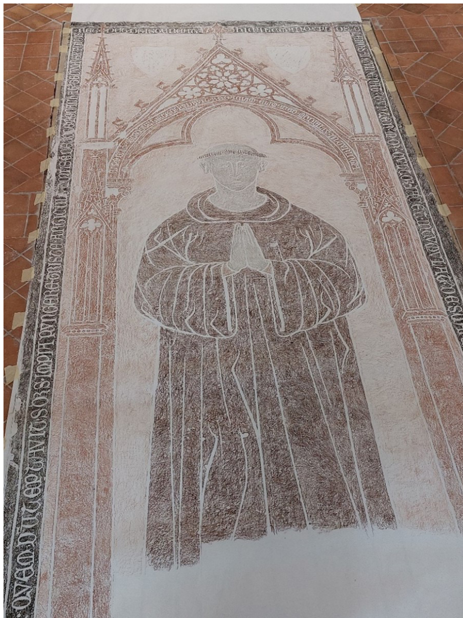
Photo 5. Le frottis in statu nascendi.